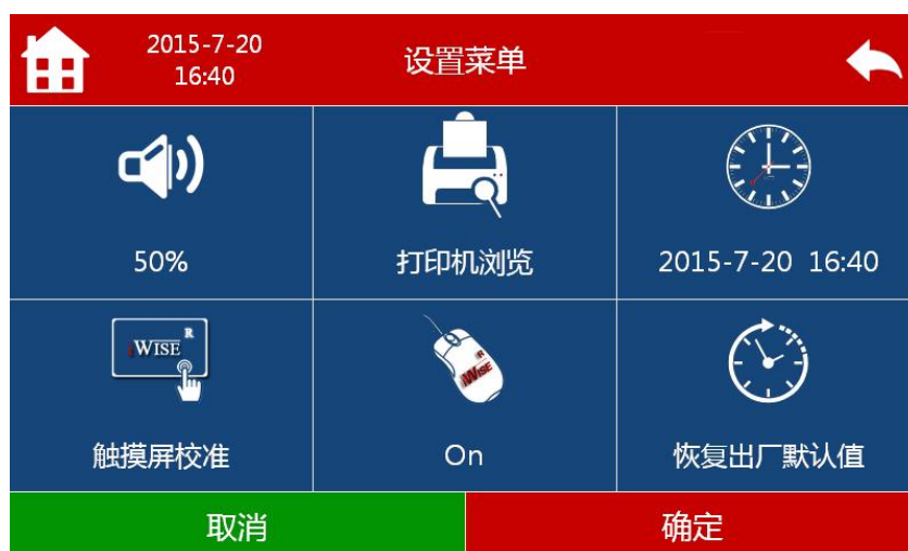
图 2 设置模式菜单