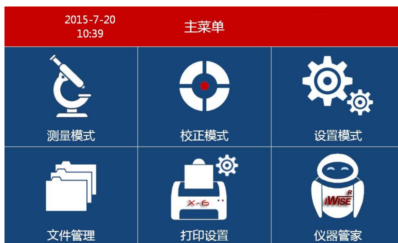
图 1 主菜单

插好电源线，然后拨动电源开关，机器将进入开机程序，待机器完全启动好后，将显示主菜单界面，如图 1 所示。