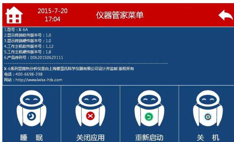
图 3 仪器管家菜单